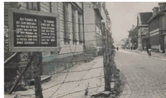
Ghetto von Riga

Am 1. Juli 1941 hatten deutsche Truppen Riga eingenommen. Noch bevor die Eroberung von Riga abgeschlossen war, kam es zu Übergriffen von lettischen Nationalisten, bei denen mehr als 6.000 Juden ermordet, und vor den Toren der Stadt im Wald von Bikernieki verscharrt wurden. Nach dem raschen Aufbau einer Verwaltung begannen die Besatzer mit systematischen Judenverfolgungen in ganz Lettland. In den größeren Städten wurde die Einrichtung von Ghettos befohlen, in Riga war das am 21. Juli 1941. Gesunde und meist männliche Ghettobewohner wurden zur Zwangsarbeit in den Betrieben der Kriegswirtschaft gezwungen.